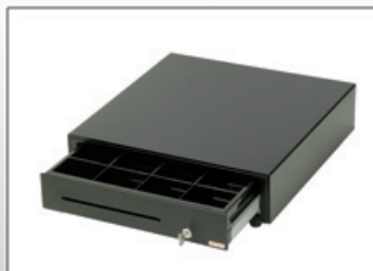
Tiroir caisse connecté