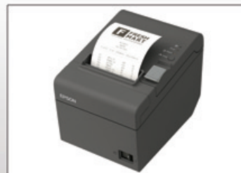
Imprimante Ticket de caisse