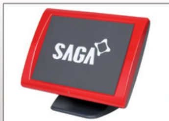
Terminal Point de Vente